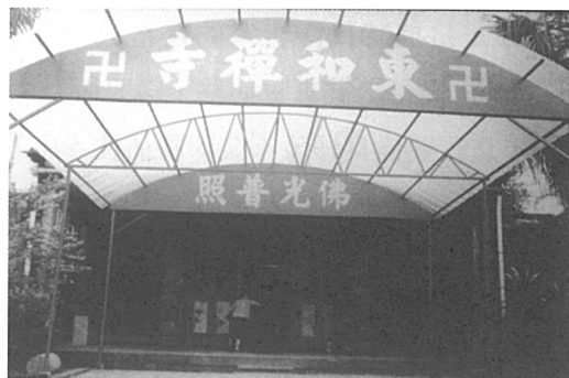
圖四：今之東和禪寺 (即原別院之觀音禪堂) (攝於1989年)。