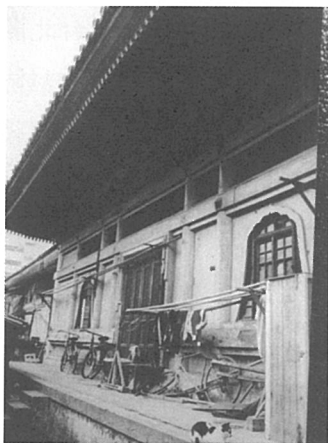
圖三：別院大殿被佔用情形 (攝於1989年)。