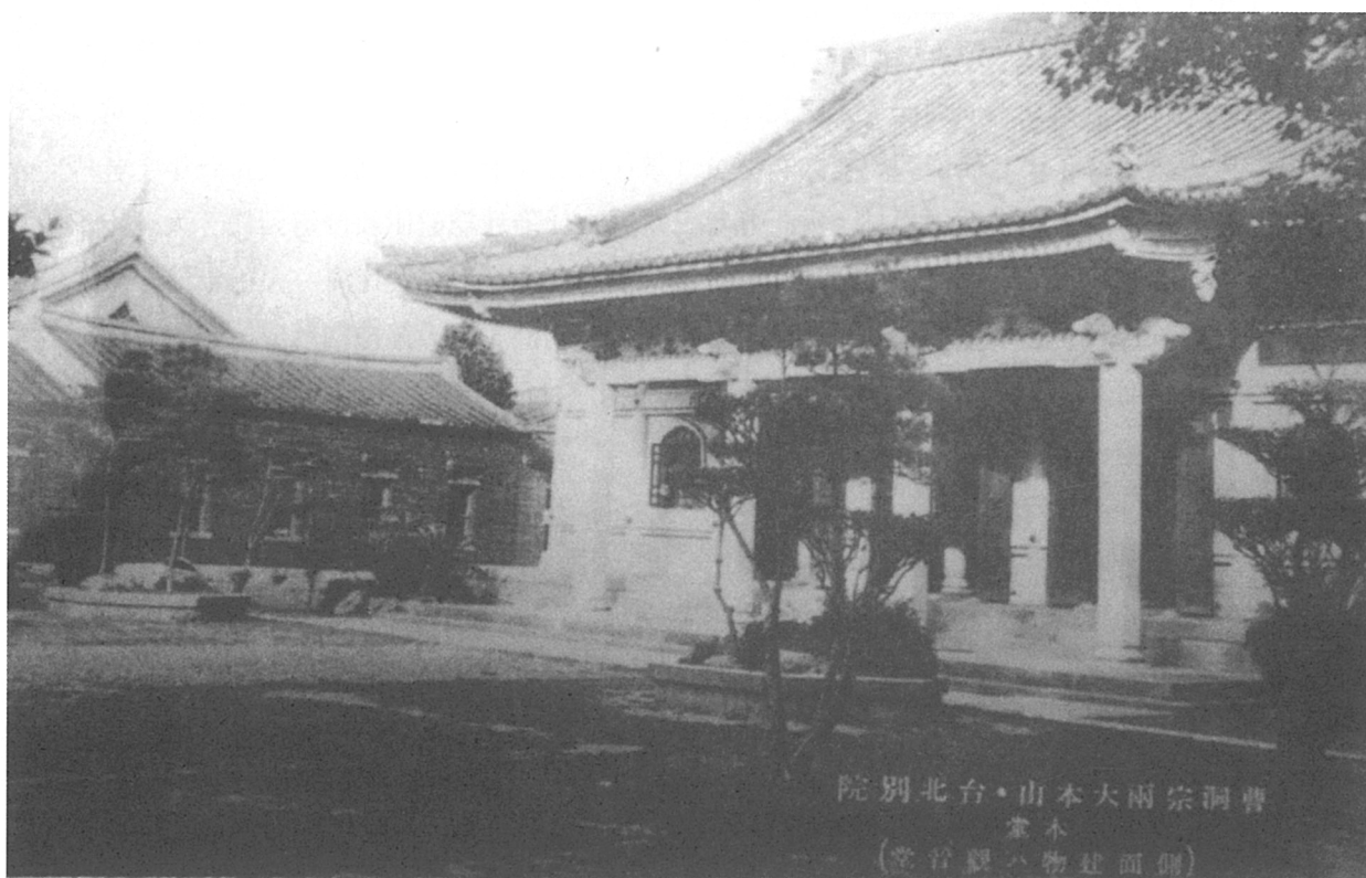
圖一 當年位於台北東門町的曹洞宗大本山 台北別院 觀音堂 觀音講會信眾與住持（佈教總監）水上興基（1923年10月到任）及心源和尚合影於別院的大殿內。