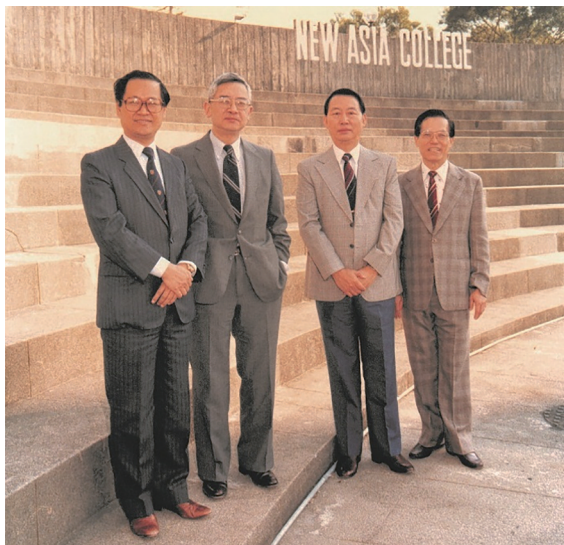
1986 年訪問新亞 (左起) 陳佳霽、余英時、周卓懷、張端友

在一九五五年到了劍橋之後，英時兄的事業可謂一帆風順，一往無前，此後碰到的唯一挫折，便是一九七三～七五年回到中文大學擔任新亞書院校長那一段經歷了。當時他由於主持負責大學改制的工作小組而飽受攻擊和非議，心理大受創傷，從而堅定了返回美國執教的決心。這在當時看來非常之不幸，其實也不盡然。因為無論從個人志趣或者日後事業發展的角度來看，回到美國東岸的常春藤盟校從事研究和教學，對英時兄而言恐怕都遠勝於耗費大量精力去領導一所新成立的學府。而且，此問題背後還有另一層曲折：他赴美之初本來與恩師賓四先生有訪問完畢或學成之後返回新亞任教之約，此後錢先生雖然離開新亞，而新亞又併入了中文大學，但他是極重情誼之人，所以在七〇年代應邀出任新亞書院校長，其實仍然頗有踐約味道；此外中大創校校長李卓敏對他盛意拳拳，當也是希望能夠動之以情，把他留下作為繼任人。因此，無論他的私衷和本意如何，去留都將成為艱難抉擇。然而，工作小組事件所帶來的巨大打擊和傷害卻一舉為他清償所有人情欠負，從而在無形中完全消解了去留問題。這樣看來，那一段長達兩三年的痛苦經歷也的確可謂焉知非福了。 ⑤